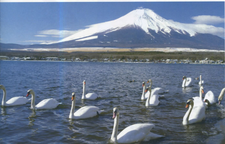
▲富士山と山坪湖・白鳥 名古屋地方本部 名古屋運輸車両支部 山守 勇