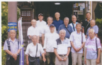
▲納涼会に参加した皆さん

富士川町は、甲府盆地の南西部に位置し、一級河川富士川に沿って集落が発達してきました。そのため、物資の往復や身延山参詣などの人の往來の拠点として栄えました。この環境から多くのすぐれた人物が生まれ育ち功績を残しました。