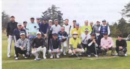
▲ゴルフコンペ大会に参加した皆さん

アクセスについては関西地方や中部地方の双方からも良く、名神高速道路の電王ICから約15分、名神高速道路の蒲