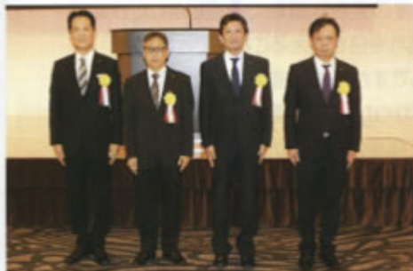
◀国土交通大臣表彰