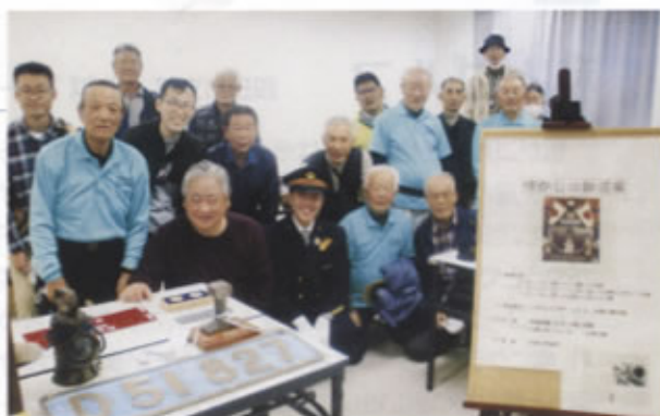
▲「懐かしの鉄道展」に参加した皆さん

またコース途中では本町公園の車庫を開放し、保存中の「D51266号機関車」を公開、運転台への乗車、蒸気機関車の仕組み解説、蒸気機関車の写真展示など行いました。案内は毎月定期的に清掃活動を行う「中津川市D51会」(OB会員が中心)会員が担当しました。