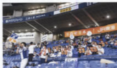
「坂河鉄道999」や「Supreme Toughness」などを演奏した音楽クラブ