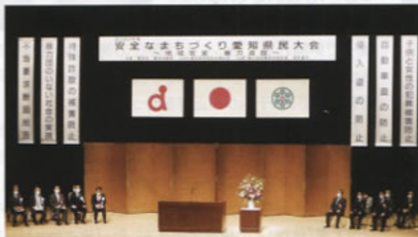
▲安全なまちづくり愛知県民大会の様子