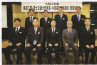
▲運輸局長表彰(静岡支社)