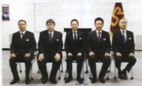
◀運輸局長表彰 (東海鉄道事業本部)