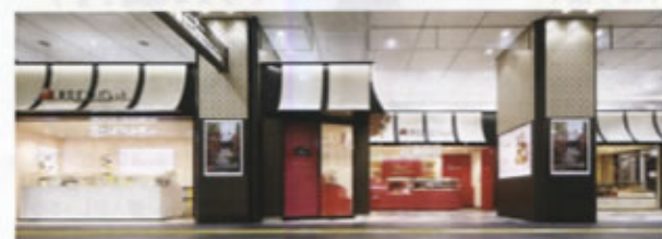
▲リニューアルした「東京ギフトパレット」の様子

東京駅八重洲北口改札を出てすぐにある、彩り豊かなお土産が揃う「東京ギフトパレット」が、11月16日、売場を広げてリニューアルオープンしました。