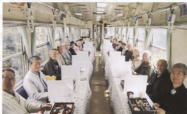
▲きのご列車に参加した皆さん