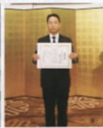
▲運輸局長表彰(関西支社)