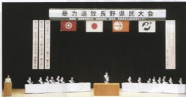
▲暴力追放長野県民大会の様子

引き続き、中央新幹線建設工事における暴力団等反社会的勢力の排除を徹底していきます。