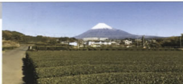
▲雪の積もった冬の富士山が一番