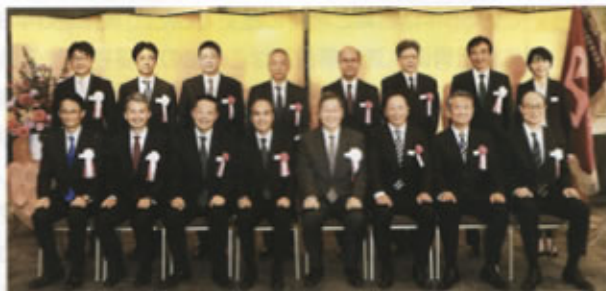
▲運輸局長表彰(新幹線鉄道事業本部)