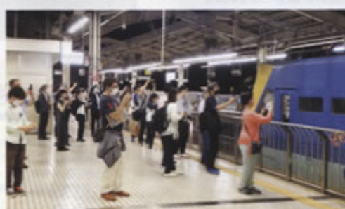
◀ホームで確認車を見学する参加者