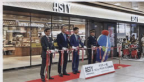
◀開業セレモニーにおけるテープカット