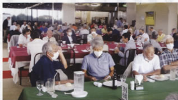
▲ゴルフ大会・懇親会でのひととき

当日は、台風等の影響もなく、清々しい天候に恵まれ、感染拡大防止を図りながら競技を行いました。競技内容は、Wペリヤ方式で75歳以上はシニアティーから打つルールで従来