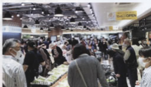
◀リニューアルオープン初日の様子