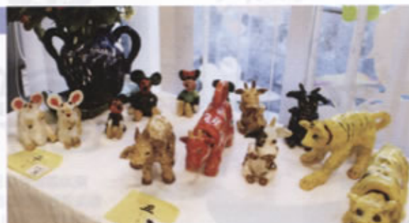
▲展示会での十二支作品

完成した作品を展示し、夏休みの成果記念品として思い出作りとなり、保護者から大変感謝されています。