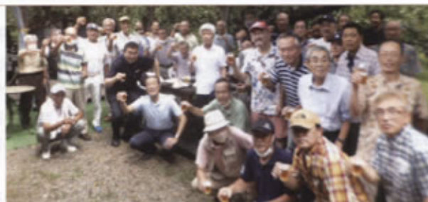
▲ぶどう狩りに参加した皆さん

ぶどう農園にはシャインマスカットやベリーA、ピオーネなど数種類のぶどうがたわわに実り、参加者は思い思いにお好みのぶどうを被せてある保護袋の上から手触りで吟味し狩り取っておりました。過去に参加した人からは「このぶどうは甘くて美味しい」と評価をいただいております、この日も多い人は買い物カゴ4個分のぶどうを買い取っておりました。