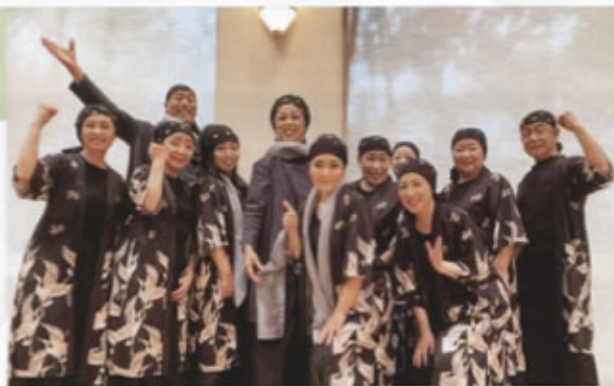
▲コンサートに出演したチームの皆さんと

ルを歌うチーム)として出演しています。5月にはワンガリーマータイをモデルにした「ハチドリ」のひとしずく」という公演で「Beautiful Africa」などアフリカの曲を歌いました。新しいところでは、聖徳太子ご生誕1400年を祝い、「和をもって尊し」という舞台上、元宝塚歌劇団と元OSKのスターの方々と共に共演し、一緒に歌うという、なかなか出来ない凄い経験をさせていただきました。