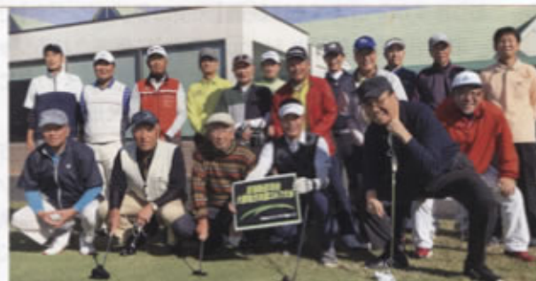
▲ゴルフ大会に参加した皆さん

今回開催した「大津カントリークラブ・西コース」の紹介をさせていただきます。このゴルフ場は滋賀県大津市にあり、「東コース」と「西コース」の2つに分れています。どちらのゴルフ場も京滋バイパスから近く、大阪方面からは「笠取IC」下車5分、名古屋方面からは「南郷IC」下車5分とアクセスが非常に良いゴルフ場です。ここ数年はアクセスの好条件を活かし、この「大津カントリークラブ・西コース」において東海鉄道OB会大阪地方本部のコンペを開催しています。「西コース」は18ホールで構成され、BTからは7000ヤードを越える距離があり、「東コース」と比較してもフラットで雄大なコースとなっています。また、バントの1グリーンのため、バットでは微妙なタッチが要求されるうえ、グリーン周りがタイトに仕上がっており、アプローチにも応用性が求められます。優美で雄大なスケールを誇る反面、シャープでシビアな顔を持つ本格的な