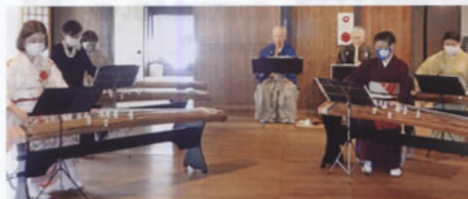
▲琴と尺八のコンサート風景

また、去年6月、三年ぶりに東海地区「諸流尺八合同競演会」が開催され出演しました。この会の目的は、伝統芸能の継承と日頃の成果を披露する場となっています。