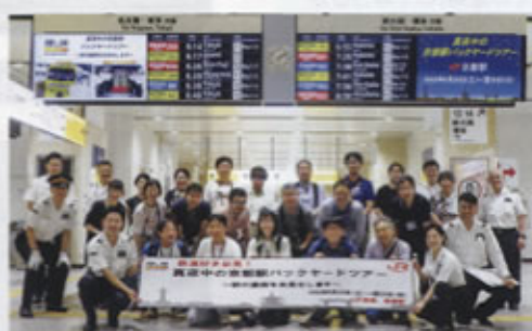
◀ツアーに参加した皆さんとともに(京都駅)