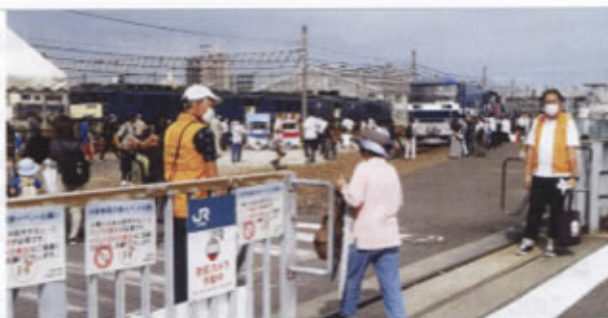
▲JR貨物稲沢駅イベント会場での案内風景

当日は、3連休の初日でしたが、大型で猛烈な台風の日本列島接近が予想されました。幸い、台風の接近前で予想された雨もなく、薄曇りのウォーキング日和となりました。今回のコースは、今秋季の鉄道満喫コースの一つとして設定され、コースの目玉は、JR貨物とタイアップしたJR貨物の稲沢駅見学イベント、鉄道OB会稲機支部が維持管理されている稲沢市宮浦公園のSL(D51-823)特別公開でした。稲沢支部のメンバーは、JR貨物稲沢駅イベント会場の入口・出口で、ウォーキング参加者の案内・誘導を行いました。イベントでは、最新の桃太郎機関車(EF210-345)や定期運行を終えたDD51型ディーゼル機関車(DD51-1801)などの車両展示、鉄道グッズ販売などがあり、特に、機関車運転台見学は長蛇の列となり、大変な盛況振りでした。