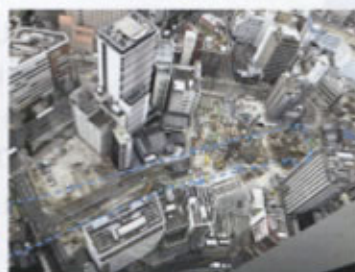
▲名古屋駅東工区全景 (破線部は名古屋駅の概ねの範囲)