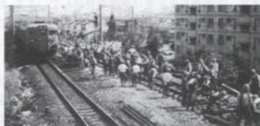
▲懸命な復旧作業(静局 家庭だより)