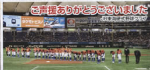
ご声援ありがとうございました JR東海硬式野球クラブ