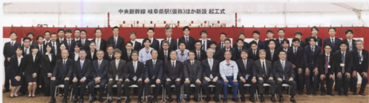
▲安全祈願式に出席した皆さん