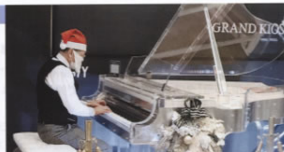
▲クリスタルグランドピアノでの演奏風景

10時開始の最初に音大出のアスティ社員による演奏セレモニーがあり、引き続いて念願の「一番弾き」を得た71歳の私の演奏となりました。演奏にあたりサンタの帽子をかぶり雰囲気を出してクリスマスバージョンとして最初に「きよしこの夜」を演奏し、続いてクラシックからモーツァルトのピアノ協奏曲第21番第2楽章を、そして「禁じられた遊び」の映画音楽からはスペイン民謡の「愛のロマン