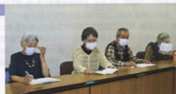
▲短歌会のみなさんとの集い

です。たった三十一文字という文字数ですがこの国に生きた先人たちが万感の思いを込め、家族や仲間、未来に生きる人々に語り残した「究極のタイムカプセル」でもあるのだと思います。短歌は難しいと思われるかもしれませんが、その様な事は有りません。今見て感じた事、驚き、発見を言葉にして五七五七七のリズムに合わせれば短歌です。私が最近、感銘を受けた歌があります。