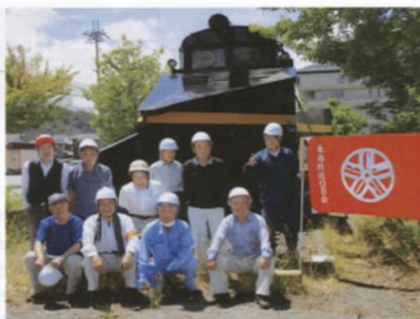
▲清掃活動に参加したみなさん

ロキ555は、昭和18年に製造され、現在保存されているのは、全国で小樽の総合博物館と米原市だけと云われている。現在の、日本の大動脈輸送は新幹線が担っているが、それまでは東海道線が大動脈として、冬季における米原・関ヶ原間の豪雪地域で、その一端をロキ555が担ってきたものであり、そのような貴重な鉄道遺産の、保存作業に貢献したいと、