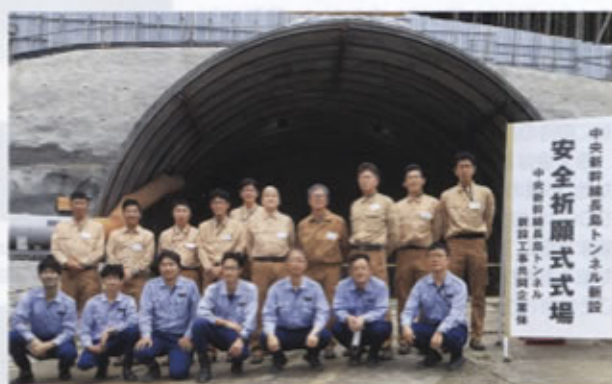
▲岐阜工事事務所とJV(共同企業体)の皆さん

賓にお招きし、工事の安全を祈願しました。また、恵那市内でトンネル掘削工事に着手するのは初めてということで報道機関にも安全祈願式を公開しました。式典後は、工事施工ヤード内で斜坑を用いず本坑から掘削する施工方法、安全対策といった工事の概要に加えて、発生土の運搬方法や使用する重機などについても丁寧に説明し、多くの新聞やテレビで取り上げられました。