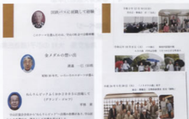
▲思い出集・寄稿文集