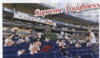
鉄道にちなんだ曲「銀河鉄道999」やオリジナルの新曲「Supreme Toughness」などを演奏した音楽クラブ