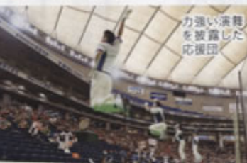
力強い演舞を披露した応援団