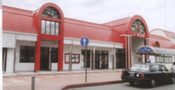
▲リンゴをイメージした赤い屋根の飯田駅

こうした地域が、今や「リニア駅ができる町」として脚光を浴び、事実リニア敷設に欠かせないであろう天竜川橋梁、トンネル工事等々、また、関連する道路事業、リニア駅周辺の整備、これに伴う移転代替地事業等の工事が、佳境に入りつつあります。