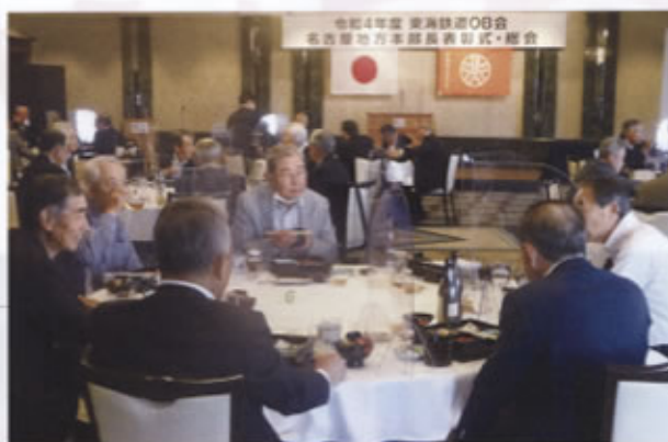
▲久しぶりの再会で、時が過ぎるのを忘れるほど

令和3年度も、新型コロナウイルス感染症拡大に伴い、各支部では計画した活動の殆どを自粛する中で、感染症対策を