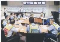
▲ブライン型の対策本部運営訓練(新幹線鉄道事業本部 対策本部)

訓練できないことは実際の災害場面でもできないということを念頭に置き、引き続き様々な想定での実践的な訓練を行うことでレベルを高め、万一の事態に備えていきましょう。