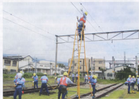
▲災害直後訓練(伊那松島乗務区)