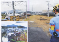
▲ドローンを活用した被災状況把握訓練/左下ドローンからの映像(中津川町)

在来線では、山間部での被災など社員が辿り着けない場を想定したドローンによる被災状況把握訓練等、より厳しい状況を想定した訓練を行いました。