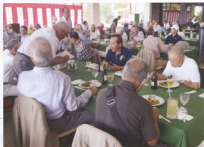
▲日常生活を忘れ一日楽しむことができました

競技は、Wペリヤ方式で75歳以上はゴールドティーから打つことができるルールで開催しましたが、皆さん元気凛冽と