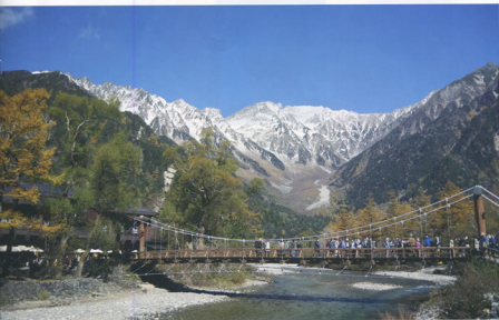
▲河津橋と穂高連峰を望む 名古屋運輸車両支部 山竹 勇