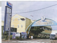
▲市場の雰囲気は味わうことのできる場所です

また、焼津市は水産加工業も盛んに行われており、節節の生産をはじめ黒はんぺんや練り製品や珍味とされる鰯の塩辛や各種の魚の干物製品等があります。市内の飲食店では、鮎や鰯料理を筆頭に海鮮料理が数多く提供されています。これらの製品や料理店を一同に集めた総合市場が焼津さかなセンターです。場所は東名高速道路焼津インターの隣に位置しているため、県内外からの利用客が多く来場されます。