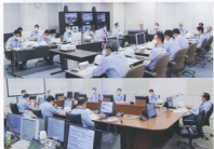
▲本社対策本部運営訓練(上段:JRセントラルタワーズ/下段:丸の内中央ビル)

新幹線では、大地震により駅間が長時間停車した場合を想定し、熱中症など体調の優れないお客さまや日本語が通じないお客さまを各系統の社員が協力して避難誘導する訓練、