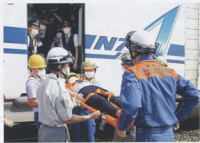
▲乗務員と地区隊及び消防隊との連携による旅客救護訓練(三島車両所)