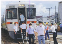
▲旅客誘導訓練(神領車庫区)