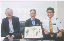
▲支部活動の一つとして取り組みました

また、12月8日の尾張一宮駅開催コースには5名を派遣し、戦国武将をラッピングした臨時イベント列車の歓迎セレモニーに、JR東海社員・地元自治体関係者らとともに参加したほか、コースマップの配布等、お客様へのウェルカム対応に努