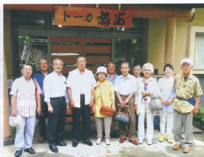
▲今回のような旅を今後も期待しています

翌27日も猛暑日でしたが、女性会員達のものんびり出来るのとこで「アカオハーブαローズガーデン」に立ち寄り、園