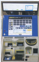
▲指定席券売機(桑名駅)