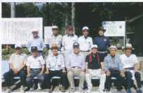
▲暑さに負けることなくこれからもプレーを楽しみます

地元松川町の方には、特別にハンディを付けたのですが、コース慣れと実力が相まって上位に入賞される結果となり、また、ホールインワンを出した方などは、本人も驚くことしきりで、周囲からは大きな拍手が贈られました。