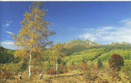
▲乗鞍高原の秋 名古屋運輸車両支部 山守 勇