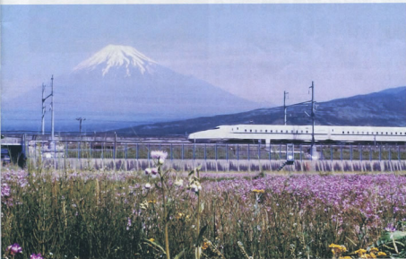
▲富士市富士岡地内から見た風景 静岡支部 中西 啓一