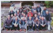
▲隣接支部との交流も回を重ねる毎に深まっています

全国でも唯一の紙神「川上御前」を祀る国の重要文化財である「岡太神社」と「大瀬神社」では、地元ガイドの説明を聞いていますと、2018年が開山以来1300年となり、5月に「千三百年大祭-御神忌」が開催され、また、この歴史ある本殿は、名棟梁大久保勘左衛門の手による建築物で、彼は最も美しい社殿建築を考えたそうです。普通の社殿は拝殿と本殿はそれぞれ独立して建てられる場合が多いようですが、大久保