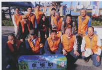
▲参加者の皆様の安全確保に努めました

「お伊勢参らばお多賀へ参れ、お伊勢お多賀の子でござる」と詠われ信仰を集め、延命長寿・縁結びの御利益や、戦国時代には、戦国武将武田信玄や豊臣秀吉が信仰を寄せたと云われる事で知られた多賀大社を中心としたコースで、米原駅から近江鉄道で多賀大社前駅に向かい、駅から多賀大社の参道を歩き本殿に参拝後、途中、天守寺(五百羅漢)をお参りして