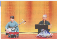
▲第七十回 諸流尺八合同演奏会での様子