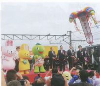
▲記念セレモニーの様子(神領車両区内広場)

春日井駅コースでは、神領運輸区・神領車両区社員を中心に、多治見保線区・多治見電力区・多治見信号通信区社員がそれぞれの特徴を活かしたお仕事紹介ブースを展開し、来場した約7,000名の方に楽しんでいただきました。また記念セレモニーも開催し、当社音楽クラブの素敵な演奏の中、東海鉄道事業本部長の挨拶や春日井市長を招いてのくす玉割りなど、お客さまと一緒に500万人達成をお祝しました。