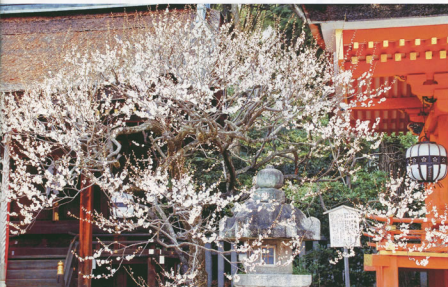
▲北野天満宮の白梅 桑名支部 近藤 昭彦