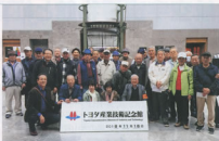
▲近くで美しい名古屋の名所を楽しみました

次に「ノリタケの森」へ徒歩で移動し、ここでは陶磁器の製造工程や初期のノリタケの食器などの製品を見学しました。昼食後は、天守閣の木造化で話題となっている名古屋城に移動しました。現在は、石塔の耐震性が低いことに対応するための調査で天守閣へは入れませんが、今年6月に公開された本丸御殿では、見学者の長い行列ができていましたが、