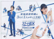
▲「スマートEX」ポスター

さまに「スマートEX」の便利さを体験していただくために、7月から8月にかけて、ご利用の会員さまに抽選で豪華景品が当たる「スマートEX」100万人突破記念キャンペーンを展開しました。