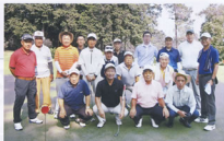
▲暑さに負けず全力でプレーしました

この大会は、毎日42歳の若手から73歳と幅広い年齢層(平均年齢67歳)の中でのプレーとなりましたが、とにかく暑さとの戦いに加え、美しいコースではありましたが、池越え、