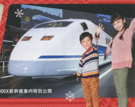
300X新幹線車内特別公開