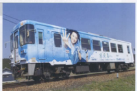
▲半分青い放映に合わせて車両にもスケッチされました

特に五平餅は、ワラジ手にぎりダンゴの種類があり、味噌とくるみなどが入って大変美味しく、また、地酒は昔ながら