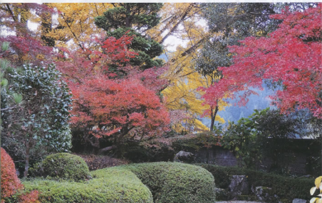
▲岡野金山 もみじ寺(玉蔵寺) 美濃太田支部 杉山 寛仁