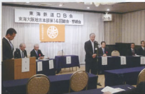
▲最後の挨拶をされる和泉本部長

続いて審議に入り、平成29年度活動報告、収支決算書報告、監査報告に続いて、平成30年度の活動方針、予算(案)、役員改選(案)が提案され、原案通り全会一致で承認されま