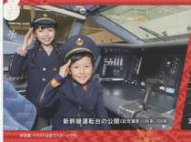
新幹線運転士の公開(記念乗車)100系・700系