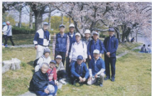
▲ご主人お孫さんの参加は、一挙両得でした

なお、佐鳴湖では他の場所では見られない水鳥が沢山見られることもあり、今年2月24日にNHKの番組で取り上げられ放映されました。この番組の中で「25分間で24種類も水鳥が見られるのは珍しい」とのことで、私達も何種類かの水鳥を確認することができました。しかし、正確な鳥の名前は解りませんでしたが、こうした環境の良い所だからこそ、多くの種類の鳥が生息しているんだと実感しました。このような景色も空気も良い佐鳴湖周辺を89才の高齢者から8才の子供まで和気あいあいウォーキングを楽しみました。「楽しかったなあ。また秋には元気で会おうね!」と言葉を交わして帰路につきました。天候にも恵まれ、桜も楽しめ良い交流が図れた佐鳴湖ウォーキングでした。