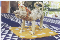
▲丹精込めて作られた藁細工

それから私の藁細工行脚が始まりました。宝船に始まって帆船、伊勢工ビ、龍亀、十二支の干支(伊豆半島や山形などにも出張ったりして)、また、家の正月飾りなどを作るようになり、毎年10月頃から暮れまでは大忙しの日々を送っています。家の中は藁のにおいで充満しています。そうそう、その割にもう一仕事がありました。9月には友人の田んぼの稲をボックス車満杯になるまで刈らせてもらい、それ