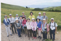
▲信州の高原は涼しかったです

当支部では、3月～11月まで5回に分け古代・中世の東海道を歩いています。これまで富士川駅～興津駅間を歩くうちに、沿線に縄文遺跡が発掘されていることが遺跡の黒耀石から分かりました。私たちの住む駿河の国には古代から黒耀石の産出はなく、信州和田峠・星箕峠産若しくは伊豆神津島・箱根峠産が主流と言われています。そこで地元の縄文遺跡の出土品黒耀石のルーツを探し、霧ヶ峰の北側にある星箕峠の発掘現場に登ることにしました。細道を辿って峠に着くと、ここは国指定の史跡となっており、20数箇所発掘の跡が見られ、発掘作業が今も続けられていました。驚いたことに足元を見ると黒光りする黒耀石の破片が浮き出ているではありませんか!