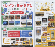
▲ポスター（家族で楽しめるスポット編）

さらに「電車で美術館めぐり編」では、対象11施設のうち4箇所に分かれたエリアの美術館のスタンプを各1個、合計4個集めると、対象美術館のうち1館入場無料または貴生堂アートハウス小村書店ポストカード6枚セットをプレゼントし