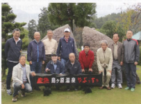
▲小雨の中で記念写真を撮りあるとは温泉を満喫

温泉は、こっとうの湯、展露露天風呂(月待の湯)、大浴場(さらすべの湯)などがあり、効能としては関節リウマチ、神経