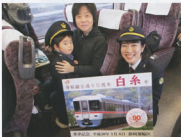
▲記念撮影の様子(車内)

キャンペーンの幕開けとして、1月6日に富士宮駅スタートのさわやかウォーキングに合わせ、臨時急行「身延線全通90周年白糸」号を浜松~富士宮間で運転しました。