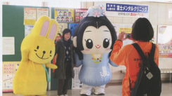
▲お出迎えの様子(富士宮駅)