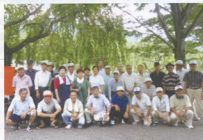
▲汗を流しながら元気一杯楽しみました

みんな「本当に良かったね、楽しかったね、美味しかったね、また行きましよう」と言葉交わして別れました。女性参加者もあり和気あいあいの旅行で良い交流が図れました。