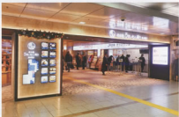
▲広小路口改札側エントランス