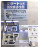
▲サポートつき指定席券売機(幸田駅)