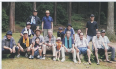
▲家族の入った活動は楽しかったです

先ずは日程、場所をどうするか、夏休みで子供達が来られること、そして土日祝日でその親御さん達も参加しやすいことを考え8月20日の日曜日とし、場所は、鈴鹿山麓の加太地区で山、川があり、釣釣りや釣りも楽しめる名阪森林パークとしました。後は食べ物(肉・ホルモン、ソーセージ、うど