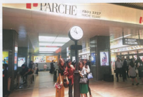
▲パルシェスクエア

快適で魅力あふれる空間に大きく生まれ変わり、開業以来多くのお客さまで賑わう「新生パルシェ」に、ぜひお立ち寄りください。