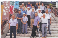
▲交流センター前で記念写真を撮りました

当初は、高瀬舟(鹿の浅い急流に強い船)による航行で人的、物的交流の動脈として発展し、昭和初期まで続いたそうです。すなわち、駿府からは主に塩や海産物を、甲州からは幕府に納める年貢米を中心に生糸等を運搬し、栄えた鍛沢船場付