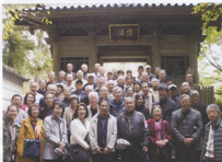
▲うなぎでお腹もふくれ笑顔満面の皆さん

の庭園は国の名勝に指定されていますが、とても美しく素晴らしいものでした。一行はガイドさんの丁寧な説明を伺いつつ、「心」の字をかたどった「心字池」が配される庭園を、寺の縁側に座りながらじっくりと堪能しました。