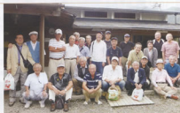
▲昨年味わった美味しいぶどう今年も味わうことができました

が咲き乱れる5月の上旬まで「竹の子掘り」ができますし、10月の下旬からは、柿(富有柿)狩りも楽しむことができます。