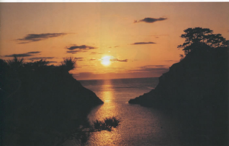
▲「西伊豆堂ヶ島の夕日」 静岡支部 中西 敬一