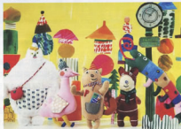
▲パルシェオリジナルキャラクター「パルネ」(写真中央)