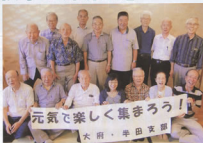
▲互いの健康を喜び楽しい一時を過ごしました

深刈とした91歳の会員を始め、会員の奥様2名にも参加していただき、天然温泉の「梅の湯」で寛ぎ、幹事の配慮もあって椅子席でゆったりと、料理は今が旬で身が一杯に詰った選