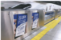
▲可動柵へのポスター掲示