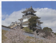
▲東海の名城「掛川城」の勇姿

次に高天神城跡です。小笠山の南東に伸びる尾根の先端にある山城です。東部の田園地帯から遠州灘まで見渡すことができ、小笠山の北を通る東海道を牽制できる重要