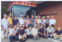
▲お湯とおしゃべりで海老しました

すっかり肌が若返り(のような気持ち)喉も潤いたところで宴会場に集合し、みんなの健康とOB会の発展を祈念して乾杯