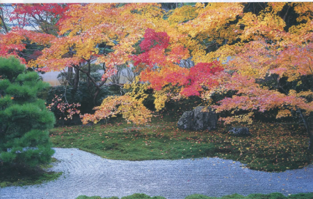
▲京都南禅寺の天徳庵庭園 名古屋運輸車両支部 山守 賢