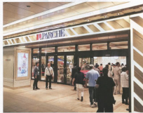
▲オープン時の様子

静岡ターミナル開発㈱が運営する静岡駅の駅ビル「バルシェ」は、昭和56年に開業し、昨年10月に35周年を迎えました。