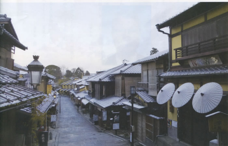
▲「冬の二年版」 東海大阪地方本部 和泉支部