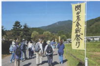
▲多くの参加者で賑わった当日の様子