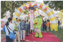
▲おゆひ若も駆けつけたスタート地点の様子

当日は、25周年を祝福するかのような好天に恵まれ、約4,400人とたくさんの方にご参加いただき、歴史的にも有名な関ヶ原で新たな「さわやかウォーキング」の歴史を刻むことができました。これからも多くの方楽しんでいただけるよう、地域の皆さまと連携し、魅力あるコースを提供していきます。