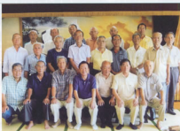
▲海の幸を堪能しました

11時半に予定通りホテル小野浦に到着し、早々に温泉(36.8度塩化物泉)に飛び込み汗を流した後、楽しみにしていた海鮮料理で宴会を始めました。各々海の幸に舌鼓を打ち、全員和気あいあいとオシャンビューの部屋から伊勢湾を眺めながら酒を酌み交わし、カラオケも懐メロ等々懐かしい曲が流れる中、懇親会も盛況となり楽しい一時を過