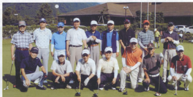
▲青空の下、皆さんで楽しむゴルフは最高です

今後ともゴルフを楽しみながら、会員相互の更なる親睦を深めつつ健康寿命を延ばしていきたいと思っています。