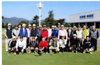
▲楽しいゴルフをモットーにするゴルフ仲間たち

フの腕前はこれに反比例するが如く、スコアは半数のメンバーが二桁であり、他のメンバーもこれに追隨する好成绩で益々磨きがかかってきている感を受けました。