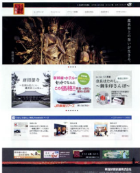
▲「うまし うわし 奈良」サイトのトップページ