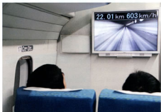
▲高速域走行試験中の車内

今回の試験で取得した貴重なデータを営業線設備の最適設計に役立てるとともに、今後も山梨リニア実験線の走行試験を通じて超電導リニア技術のブラッシュアップとコストダウンに取り組んでいきます。