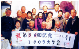
▲天々1日巻を披露にご美声の笑顔

しかし、このJO会を運営するには、出欠を含め曲目等のプログラム作成などご苦労されている裏方幹事さんに感謝を忘れず、これからも楽しい集いを続けていきたいと思っています。