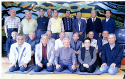
▲40年の歴史を振り返りつつ楽しみました

役員の方々のご尽力と本部の支援に感謝しつつ、暮れゆく山麓の紅葉に思いを馳せながら「鬼岩温泉」を後に全員無事に帰路につきました。