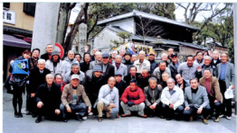
▲伏見稲荷大社門前で撮影

次の目的地は、学問の神様として信仰は昔も今も変わることなく人々の生活の中で受け継がれている「北野天満宮」は、菅原道真公をお祀りした神社の総本山、親しみを込めて