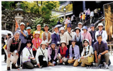
▲遺跡回りを終えた鎌向古墳の参加者

翌日は、天理市の石上神社から桜井市の大神神社までの 「山の辺の道」15kmを6時間かけて歩きました。日本最古の 道と云われるだけに沿道には多くの社寺や古墳が点在、神話 の時代の神社、環濠集落、祭神、景行天皇陵、三輪山の大神