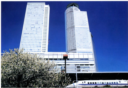
▲名古屋東支店 清水 聡弘