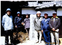
▲元気に散策を楽しむ団体

伊豆石の礎は、伊豆産の凝灰石系の石材で、この天竜川水運にて搬入され皆が使用したそうです。更に進むと松林寺、高札所跡、金原明善の生家と記念館があり、当時の貴重な資料が展示されていました。金原明善は、天竜川の治水と治山