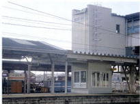
▲四日市駅に設置したエレベーター