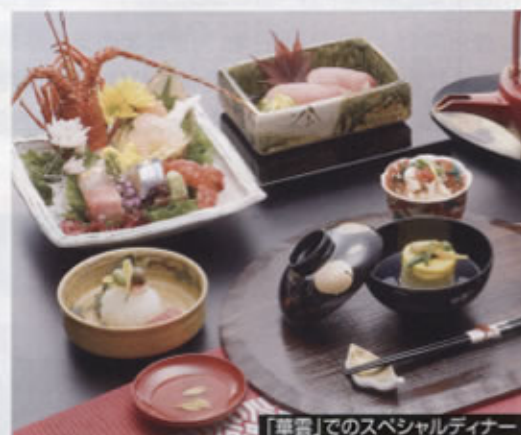
「華雲」でのスペシャルディナー