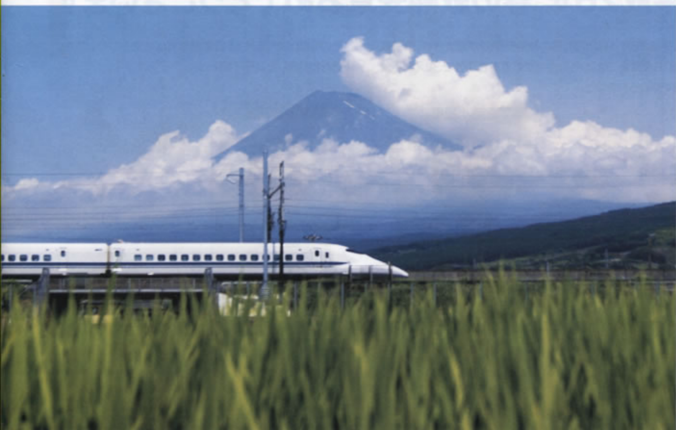
▲「夏野を走る」富士市穂里地先にて 静岡支部 中西 敬一