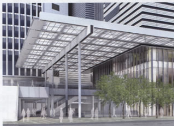
▲ビルエントランス