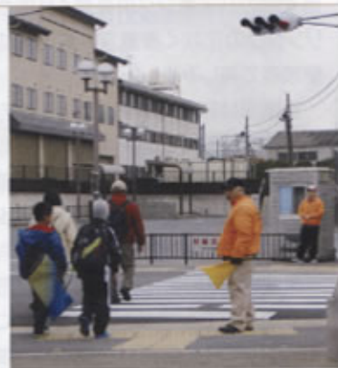
▲寒い中、横断歩道等で案内・誘導する会員

着、酒の資料館を見学、そして黄桜カップカントリーで甘酒をプレゼントされ、最後に御香宮神社を経て桃山駅まで戻って来られ、会員は、ほろ酔い気分の参加者に自分の姿を重ね、いつもとはまた一味