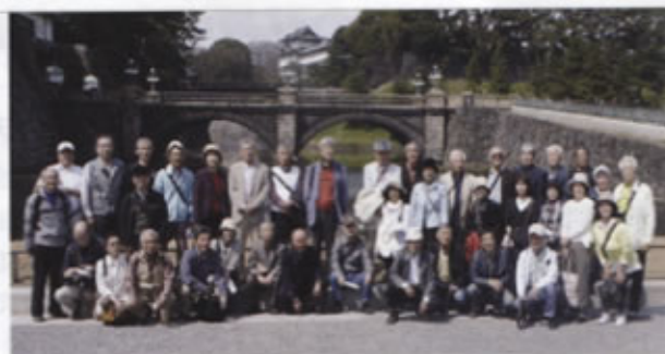
▲二重橋をバックに記念撮影をする会員・家族の皆さん

バックにお互いを撮り合ったりし、しばらくシャッター音の嵐となりました。終着の浅草では、アサヒビールのビルに写った「珍しい、金色のスカイツリー」が見られ、最後には、全員で昼食をとり散会となりました。