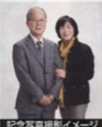
記念写真撮影イメージ