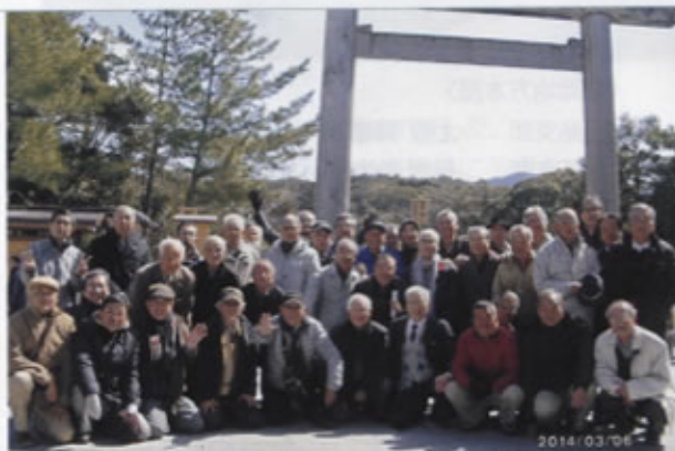
▲参加者が大鳥居の前に「にこやか」に集合

今回の伊勢神宮参拝で特筆すべきは、第62回神宮式年遷宮を期して外宮に建設された「せんぐう館」を見学出来たことです。この「せんぐう館」は広く我が国の伝統・文化を伝え、