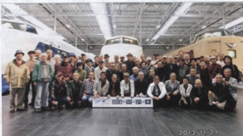
▲61名の笑顔がカメラの中に

ここまで、約3.6キロの「荒子コース」の散策を終えて、南荒子駅からあおなみ線終点の金城埠頭駅まで行き、レストラン東山ガーデンで、楽しく昼食を摂りました。軽くアルコール