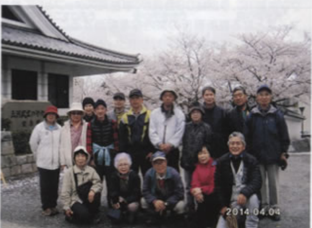
▲岡崎公園の満開の桜を育にする参加者

帰りは恒例の中国語教室、詩吟教室、マジック教室を開き、素晴らしい春の一日を楽しみました。