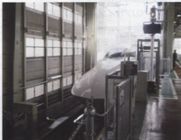
▲使用開始した引上2番線に列車が入線する様子