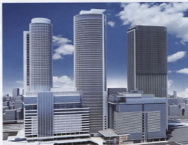
▲JRセントラルタワーズとJRゲートタワー 外観イメージ

名古屋駅周辺では現在複数の大型開発計画が進行しており、中央新幹線の開業も控え、都市機能の拡充やより良い街づくりが進んでいます。「JRゲートタワー」を魅力ある施設とし、名古屋駅周辺地区にさらなる賑わいを創出するよう、引き続き計画を着実に推進していきます。