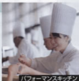
パフォーマンスキッチン