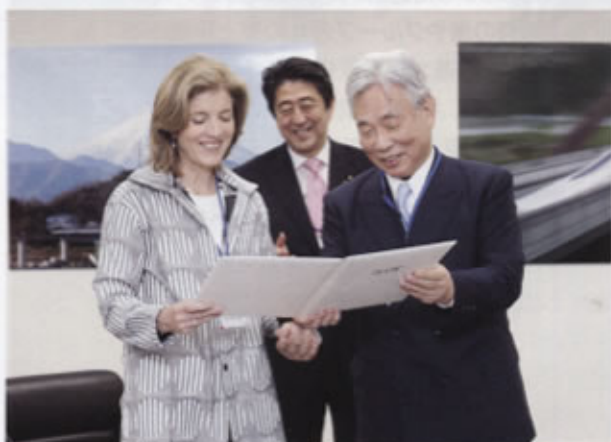
▲訪問記念のアルバム贈呈