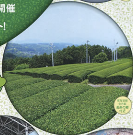
静岡県 浜松市 新城市