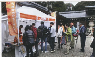
▲護国神社で参加証明を受ける参加者

神社の参道入り口には大きな鳥居があり、鳥居から先はかなりきつい上り坂になっていて、参加者は苦しそうに坂道・階段を一歩ずつ上っていました。坂を上り切ったところを目指