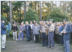
▲秩父宮記念公園で説明を受ける参加者

ホテルでは、モミジ・ドウダンツツジ等が真っ赤に色づく庭園を散歩し、途中の茶室で秋の深まりを感じながらお茶を一服。その後は、10Fの夕暮れに染まりゆく富士山が、まるごと望める露天風呂に浸かり、富士山と裸向き合いました。宴会場では、135名が一堂に集まり、それぞれに思い出が甦り、