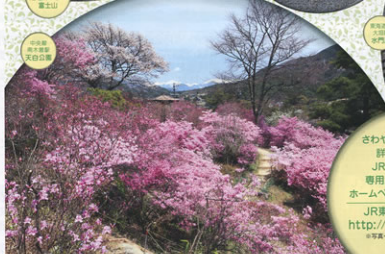
山梨県 南都賀郡 天白町