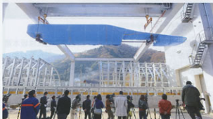
▲車体搬入の報道公開の様子

一方、山梨リニア実験線の42.8kmへの延伸と、先行区間の設備の全面的な更新工事は着実に進んでおり、平成25年末までには、この延伸・更新後の新実験線で、L0系による走行試験を開始し、実用技術として完成した超電導リニア技術のブラッシュアップに取り組んでいきます。