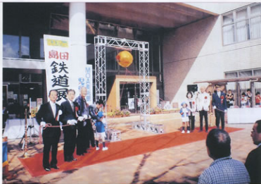
▲「島田鉄道展」のオープニングセレモニー

会場には、150車種以上のN・HOゲージ鉄道模型、70車種以上のプラモデル電車が所狭くと走り回るなど、家族連れの人場者に楽しんでもらい、入場者は当初予定を大幅に上回