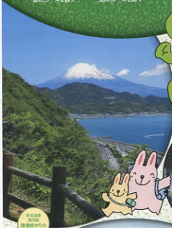
山梨県 南都賀郡 磯貝町 富士山