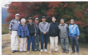
▲紅葉に染まったモミジの木の下で一息

は生憎午後から天候が崩れ断念、浴槽からの紅葉堪能に切り替え、首までお湯に浸かり紅葉を楽しみました。今回も倶楽部の目標「歩いてザブーン」を達成出来ました。