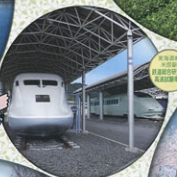
静岡県 浜松市 鉄道総合研究所 浜松駅南口