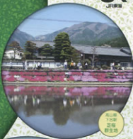
山梨県 下都賀郡 野上町