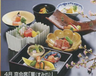
4月 京会席「華(すみれ)」