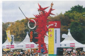
▲観光客で賑わう大道芸

う枠を超え、パフォーマンスの祭典になっています。年々盛んになり、昨年11月1～4日に行われた祭典では、4日間で154万人の人数があり、年々その規模が大きくなっています。