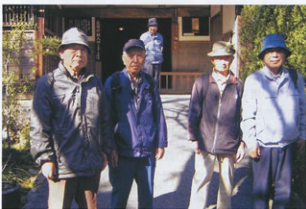
▲参加者は少ないが元気な立ち

全行程約5キロ、4時間の道のりであったが、歴史と人情あふれる町で、我々にさらなる活力を与えてくれる散策であった。