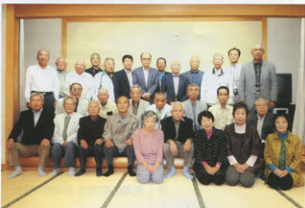
▲「あさひ荘」大広間に勢揃い

帰りの車内は、朝と違って賑やかで、これからもこのような機会を作ってほしいとの宿題をもらい、全員無事に帰宅しました。