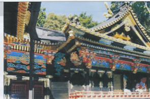
▲豪華絢爛「国宝 久能山東照宮」

平成4年に始まった市民参加型イベントは、国内で活躍する大道芸人はもとより、海外で活躍している様々な分野のストリートパーフォーマーが多数来静し、大道芸の祭典とい