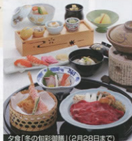
夕食「冬の旬彩御膳」(2月28日まで)