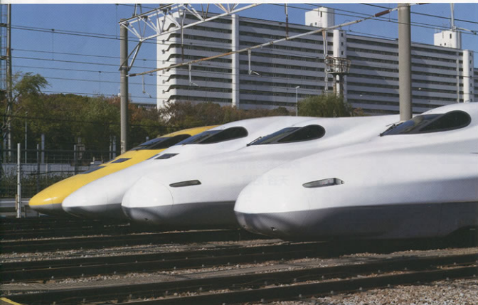
▲平成25年2月に営業運転を開始する「N700A」最前列