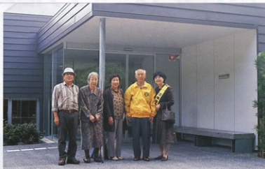
▲かなみ仏の里美術館前で...

かなみ仏の里美術館は、2008年函南町桑原地区の桑原薬師堂の24体の仏像群が、桑原地区から函南町に寄付され、町民の財産である貴重な文化財を後世に保存継承する