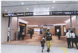
▲開通した新大阪駅北口通路