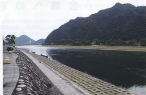
▲夏には鵜飼や花火で賑わう「清流長良川」

な町並みには、岐阜うちわや老舗の和菓子店、ギャラリーなどがレトロな雰囲気を残したまま営業しています。