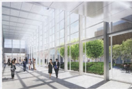
▲新ビル内観イメージ(15階)

ジェイアール名古屋タカシマヤ、ホテル開業まで工期が長期にわたりますが、引き続き、安全第一に着実に工事を進めていきます。