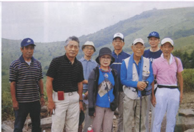
▲車山高原へ到着してホット一息

定の片倉館で入浴し、汗を流して帰路につきました。これからもみんなに参加してもらえらる高原の花と温泉の旅を企画していきたいと考えています。