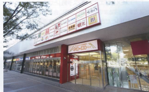
▲「ぐるめストリート」外観