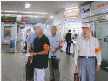
▲桑名駅で利用者にチラシを配る会員

25日は、人の手配などもあり、とりあえず支部の3役4名の参加でしたが、駅を利用するお客様に一声かけてチラシを配りました。その結果、JRに対して少しは貢献できたのではないかと大変喜んでます。