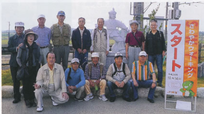
▲スタート前の元気な参加メンバー

平成24年4月に発足したばかりの支部ですが、こうしてみんなが、一緒にウォーキングに初参加できたことに喜びを感じ、今後益々、友好と親睦を深めさらに活動の場を広げて行きたいと考えています。