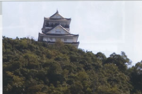
▲勇壮な姿誇る「岐阜城」

その他、金華山や長良川周辺には見どころがいっぱいで、通称「川原町」とよばれているところがあります。ここは、格子戸が連なりさずめ映画のオープンセットのよう