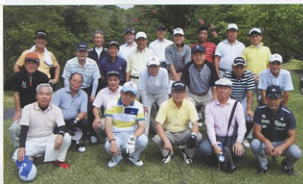
▲「優勝は俺だ」と意気込むスタート前の参加者

プレー中は予想に違わず一日中、晴れ・晴れ・晴れの天気、余りの暑さに勝てなかったのか、残り3ホールくらいになると曇さで「ハット・ヨロシロ…」になってしまい、18ホール回るのがやっとの状態でした。しかし全員が熱中症にかかることなく、無事全ホール回ることが出来ました。