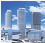
▲新ビル外観イメージ(画面右)

今後は当面、地下部分の工事が中心となりますが、平成25年度の冬頃からビルの地上部分が見えるようになり、平成26年度の冬頃にはビル最上部で上棟となる予定です。平成27年末の新ビル完成、オフィス入居開始、平成28年春の