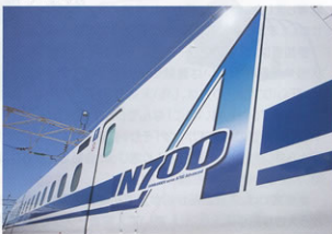
▲N700A車両シンボルマーク