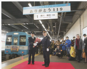
▲豊橋駅長からの花束贈呈

今後も様々な観光素材を活用し、在来線の利用促進と沿線地域の活性化を図っていきます。