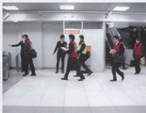
▲乗客の誘導訓練(静岡駅)