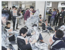
▲駅滞留者への防寒用アルミシート配布訓練(名古屋駅)

今後は、今回の訓練で得られた知見を活かし、自治体や警察、消防などと連携し、対応の深度化を図っていきます。