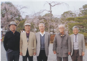
▲京都御所の枝垂れ桜の前で

殿、清凉殿等の平安時代の寝殿造りや、御学問所等宮廷の長い歴史的な建物を拝観し、築地塀で囲まれた面積11万㎡の敷地内で、千年の古都の奥深さを肌と感じました。