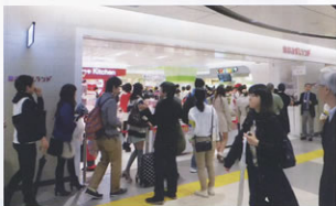
▲4月にオープンした「東京おかしランド」

5年もの長期にわたるリニューアル工事を終えて、数々の魅力的な店舗が集まった「東京駅一番街」に、ぜひお越しください。