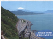
東海線-新津駅 越前湖からの富士山