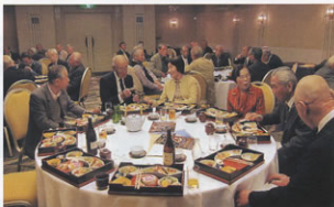
▲音楽が流れる中、女性が参加した和やかな総会