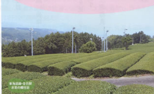
東海線-名古屋 お茶の園行