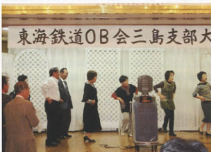
▲音楽に合わせてダンスを披露する女性会員のみなさん

選考理由としては①女性会員がレク活動及び例会で貢献されていて、支部の活性化にも生かしたい②昨年会員の死亡が10名と増加傾向にあるため、遺族会員の加入促進とフォローに女性の方が必要であること③女性会員が支部活動に積極的に参加してもらうことにより、支部全体が賑やかで明るくなり会員増強に繋がるのではと説明しました。その