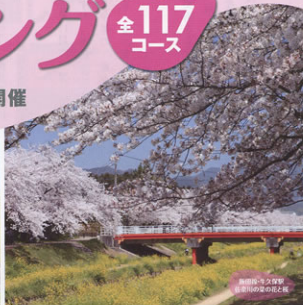
東海線-名古屋 新栄川の桜の杜之旅