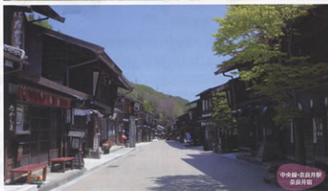
中央線-名古屋駅 会津川原