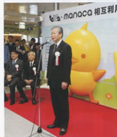
▲記念セレモニーの様子

平成25年春には、「PASMO」や「PiTaPa」等との相互利用や「manaca」との電子マネー機能の相互利用の開始を予定しています。ますます便利になる「TOICA」にご期待ください。