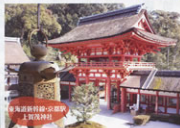
東海線新井駅-高松駅 上知神社