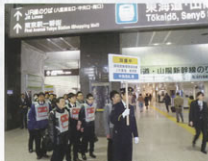
▲自治体指定の避難場所への誘導訓練(東京駅)