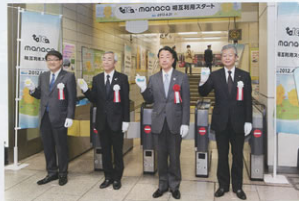
▲通り初め式の様子