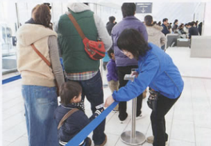
▲マグネットシート配布風景