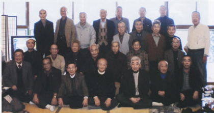
▲新年互例会を楽しんだ元気な顔ぶれ

互例会は、毎年開催していますがそれぞれに気分も変わり、みんなとの交流も深まり、来年もきつと来るぞと約束して帰りのマイクロバスに乗り込みました。