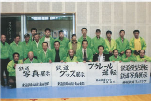
▲主催した「鉄道展」を支えたメンバー達

「鉄道展」開催にあたっては、支部の力を結集し何度も会合を開き、展示品の収集、会場の配列方法等を検討・準備、展示、来場者の案内、そして終了後の後片付け、鉄道資料・器材の返還などミスが許されない状況で、みんな一生懸命に取り組み、最後島田市から「OB会の皆さんの努力は、島田市の活性化に大きく貢献されました」と深く感謝されました。