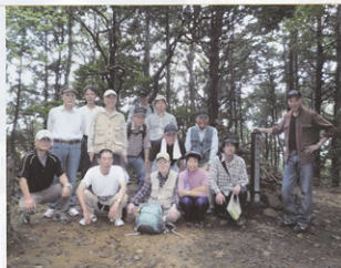
▲秋風を浴びて山歩きを楽しむ会員

山頂で少し休憩を取り、昼食場所である小倉神社を目指し出発。下り坂の山道を快調な足取りで歩き、弁当を野生猿に