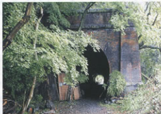
▲明治の建造物 赤煉瓦のトンネル

ボランティアは多士済々な集まりで植生、煉瓦の分析調査、写真また労働力の提供等様々で、都合の良い