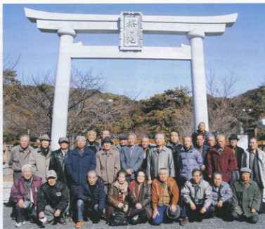
▲初詣に訪れた「桜ヶ池 池宮神社」前で