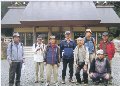
▲元気に三ヶ日宿を巡る参加者

「初生衣神社」は織機の神を祭り、古来より神衣を織って伊勢神宮へ奉獻してきた。現在も続いている。