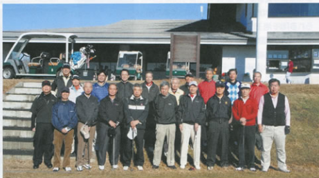
▲寒さに負けずに参加したプレーヤー