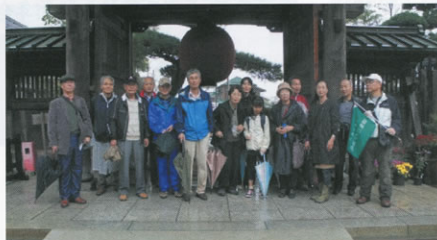
▲生憎の雨に降られた鎌倉

昨年11月19日9時30分、当地方本部主催の「第2回鎌倉散策」のため鎌倉駅に29名の参加者が集合しました。生憎の雨模様でしたが、出発当初は傘の出番はないかなーとの希望的観測も江の電が極楽寺駅に到着するころには本降りとなってしまいました。