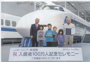
▲入館者100万人目のお客さま

オープンして1周年を迎えましたが、これからも子どもから大人まで多くのお客さまに何度でもご来館して楽しんでいただけるよう、スタッフ一丸となって取り組んでいきます。