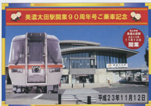
▲駅後さん手作りの記念号乗車の証

当支部は、JR東海の行事に積極的に参加しようとし、12日には記念列車(美濃太田・岐阜・名古屋・多治見・美濃太田の循環列車)に会員34名が乗車して、車内のお客さんとともに楽しいイベント列車の旅を満喫しました。また、13日には「さわやかウォーキング」が開催され、美濃加茂市の文