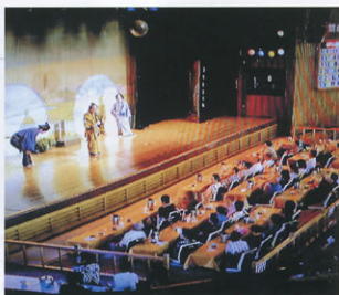
▲華やかな舞台を楽しむ参加者

試行錯誤を重ねても会員が減少するなか、年一度のこの場を求めて大先輩達が参加してくれるようになった。今回(第41回)は、特に80歳代の方が25名中10名でその効果がみてとれる。一つには、格安で、温泉にゆったり浸かり心身ともに和らげ、しかも交通の便よして温泉の質も低張性弱アルカリ性高温泉・低温泉(単純温泉)だ。