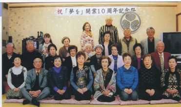
▲守山支部との交流会開催

ていたところ、お隣の守山支部から交流会をしてはとのお誘いがあり、早速始め、昨年9月から今年4月までに10回の交流会を開催しました。