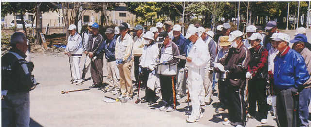
▲元気にグラウンドに勢揃いした若きプレイヤー