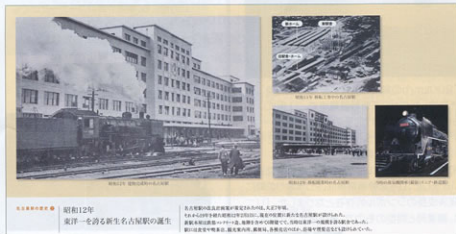
▲名古屋駅周辺の変わり変わりを紹介するパネル

名古屋ターミナルビルの解体工事は、大型重機を用いて躯体の解体工事に着手していますが、引き続き安全第一で進めてまいります。