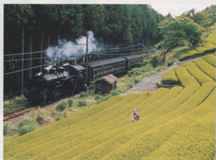
大井川鉄道 SLと八十八夜 藤枝支部 永井 強司