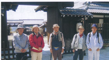
▲気賀の関所前で記念撮影

関所が出来て、附近の住民の通行も不便になったために、領主が裏道を作り、道の途中に「むしろ」を一枚垂らし、その下を犬のように這ってぐり抜けさせた。「犬くぐり道」と呼ばれ近くの村人だけの抜け道だった。