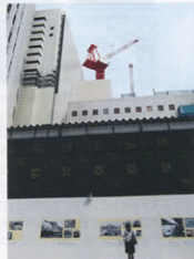
▲工事用仮設事務所の壁面緑化