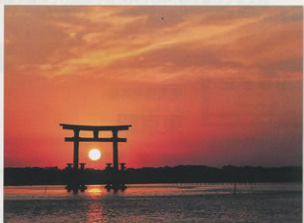
弁天島公園より浜名湖上の夕日 湖西支部 本多 喜一