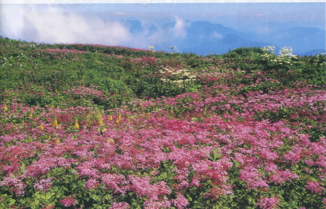
▲「伊吹山頂の花畑(シモツケソウ)」 関ヶ原支部 柏島孝