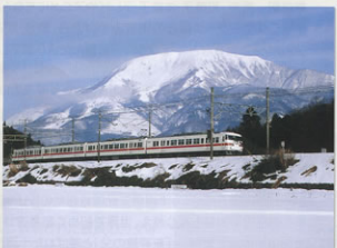
117系 雪の伊吹山・柏原地内 関ヶ原支部 柏 昌孝