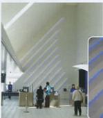
▶入館ゲートの様子

下の写真は「リニア・鉄道館」の入館ゲート正面にあるモニュメントです。気付かないで素通りしてしまいそうですが、9本の線はよくみると一つひとつが高速鉄道の発展に大きな役割を果たした車両の形になっていて、鉄道の発展の歴史をこのモニュメントを通してみることができ、それぞれどの車両を模っているのか、答えは全て「リニア・鉄道館」の中にあります。この他にも、車両や展示コーナーだけでなく館内のいたるところで鉄道にふれることができるので、いろいろ探してみてください。