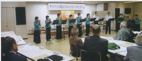
▲女性たちのハーモニカ演奏に関与する参加者

なつてからは、40%強を維持しています。総会を楽しくしようということで始めた試みですが、会員、ご来賓の方々からも好評を得ています。総会のさらなる活性化を目指して頑張ります。