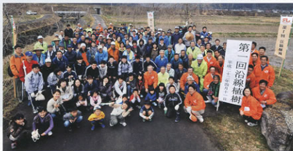
▲地域の方々とともに

4月11日に高山本線沿線の高山市一之宮町を流れる常楽寺川周辺で、沿線植樹を実施しました。沿線植樹は、鉄道沿線とその地域の魅力づけを目的として、今年からはじめて取組みです。