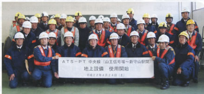
▲切替対策本部の様子