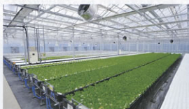
▲常滑農場(レタス棟)