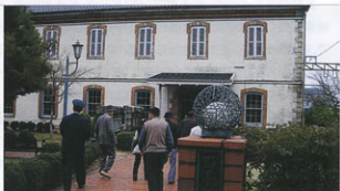
▲長浜鉄道スクエアに入る会員

きとどいた畑を眺めつつ、木之本から303号線を経て161号線の道の駅「マキノ塩塚峠」で一服、右に湖西線を見つつ海津大崎へ14時に着いた。桜トンネルの湖岸道をバスの徐行で観戦。桜三分咲きながら、満開の美しき湖畔を目に書きつつ約30分堪能した。帰路は、木之本ICから来た道を快走し、車内はビンゴゲームで盛り上がった。