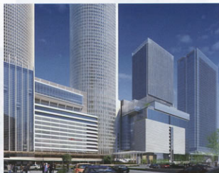
▲外観イメージ(仮設側より)

名古屋駅周辺地区にさらなる賑わいを創出する利便性の高い魅力あるビルを目指し、28年度の完成、29年度の全面開業に向け、工事を進めていきます。