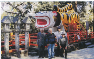
▲世界一の大福寅をリックにする会員

信貴山は当日「花まつり」で、満開の桜と好天に恵まれて参拝客も多く、我々も大和の名利「総本山信貴山」の山全体に展開している各院を満開の桜を賞でながら周り、大和平野を