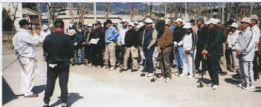
▲元気な姿で集まった参加者