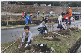
▲「コバノミツバツツジ」植樹の様子