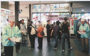
▲改札口でパンフレットを配布する会員

5月3日は、「垂井の曳輪祭り」と相川の「鯉のぼり」コースで11.4kmで所要時間は3時間30分です。この祭りは、文和2年(1353年)後光厳天皇が垂井へ頓宮された折、心労を安するため花車3台を作り御高覧を供すとあり、以後毎年行われているものです。花車は、その後安永時代に舞台作り構造となり、子供歌舞伎を演ずるようになって、江戸時代そのままに現代に引き継いでいます。