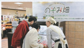
▲「のぞみ畑」販売風景