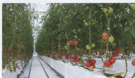
▲常滑農場(トマト棟)