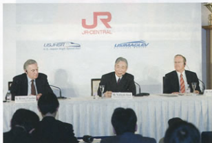
▲高速鉄道プロジェクト参入表明の様子

25日の発表は、ターゲットとする路線を特定し、海外展開の進め方を公表したものです。将来、当社の高速鉄道技術が海外で実用化されることを目指して、取り組んでいきます。