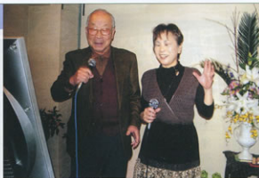
▲仲間の女性と一緒に楽しむ

ある時、OB会のみなさんと一緒にカラオケを楽しもうと思い立ち、平成18年9月に参加してもらえそうな会員15名にアタックした結果、11名の賛同者がありました。早速、皆さんの指導を兼ねて同年10月に記念すべき第1回のカラオケ会を開催しました。