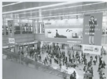
▲交通広告媒体 スカイメディア名古屋