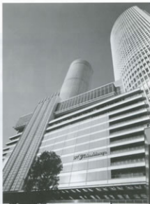
▲JRセントラルタワーズ外観

今年も年明けから日本一の売上規模を誇るバレンタインイベント「アムール・ド・ショコラ」や春のリニューアルなど、話題が盛りだくさんでスタートします。来年迎える開業10周年に向け、これまで以上にお客さまに魅力を感じていただける店舗作り、情報発信を目指してまいりますのでご期待ください。