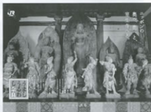
▲当社が制作した「うまし うるわし 奈良」 キャンペーンポスター

【TOICAキャラクターグッズ】 東海キヨスク(静岡・浜松・豊橋・名古屋・岐阜)の 店頭販売 インターネット通販( http://traindo.com ) 問い合わせ先 | フリーダイヤル0120-989-322 (平日10:00~17:00)