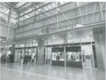
▲ジェイアール名古屋タカシマヤ