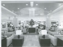
▲JRセントラルタワーズ内観